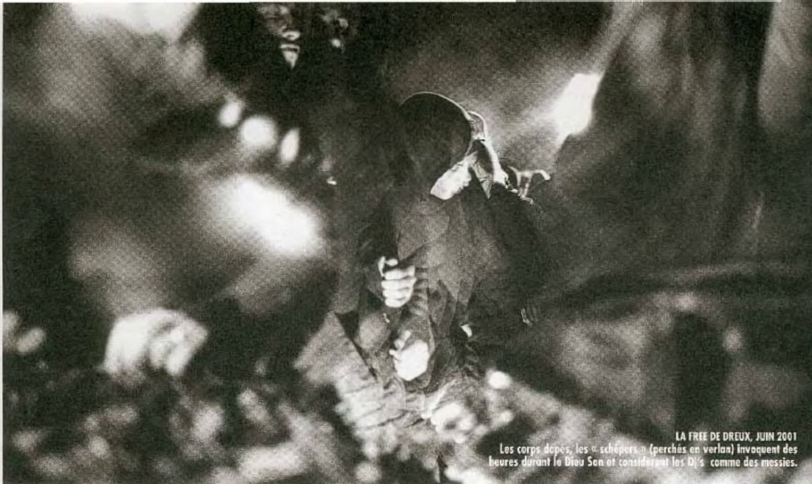
LA FREE DE DREUX, JUIN 2001 Les corps dopés, les « schépers » (perchés en verlan) invoquent des heures durant le Diou Son et considèrent les DJ's comme des messies.