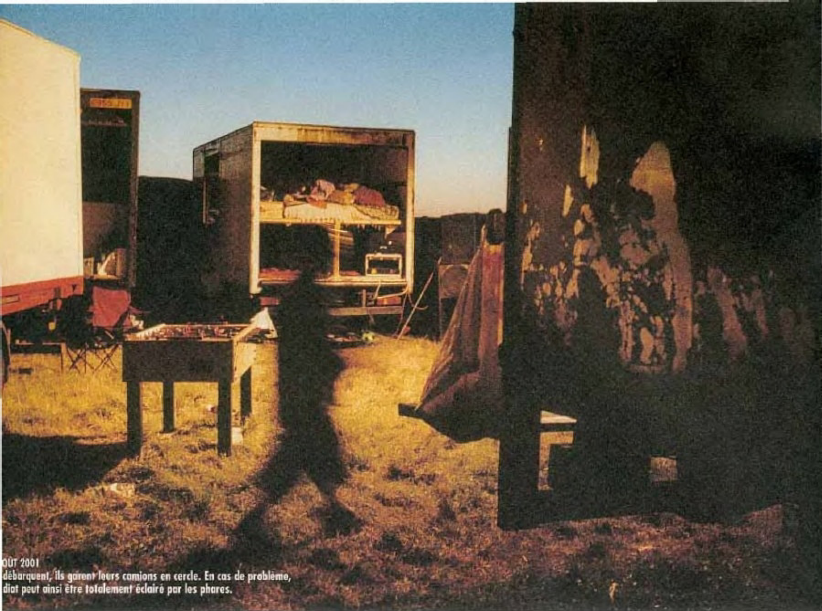
10 août 2001 débarquent, ils gèrent leurs camions en cercle. En cas de problème, diat peut ainsi être totalement éclairé par les phares.